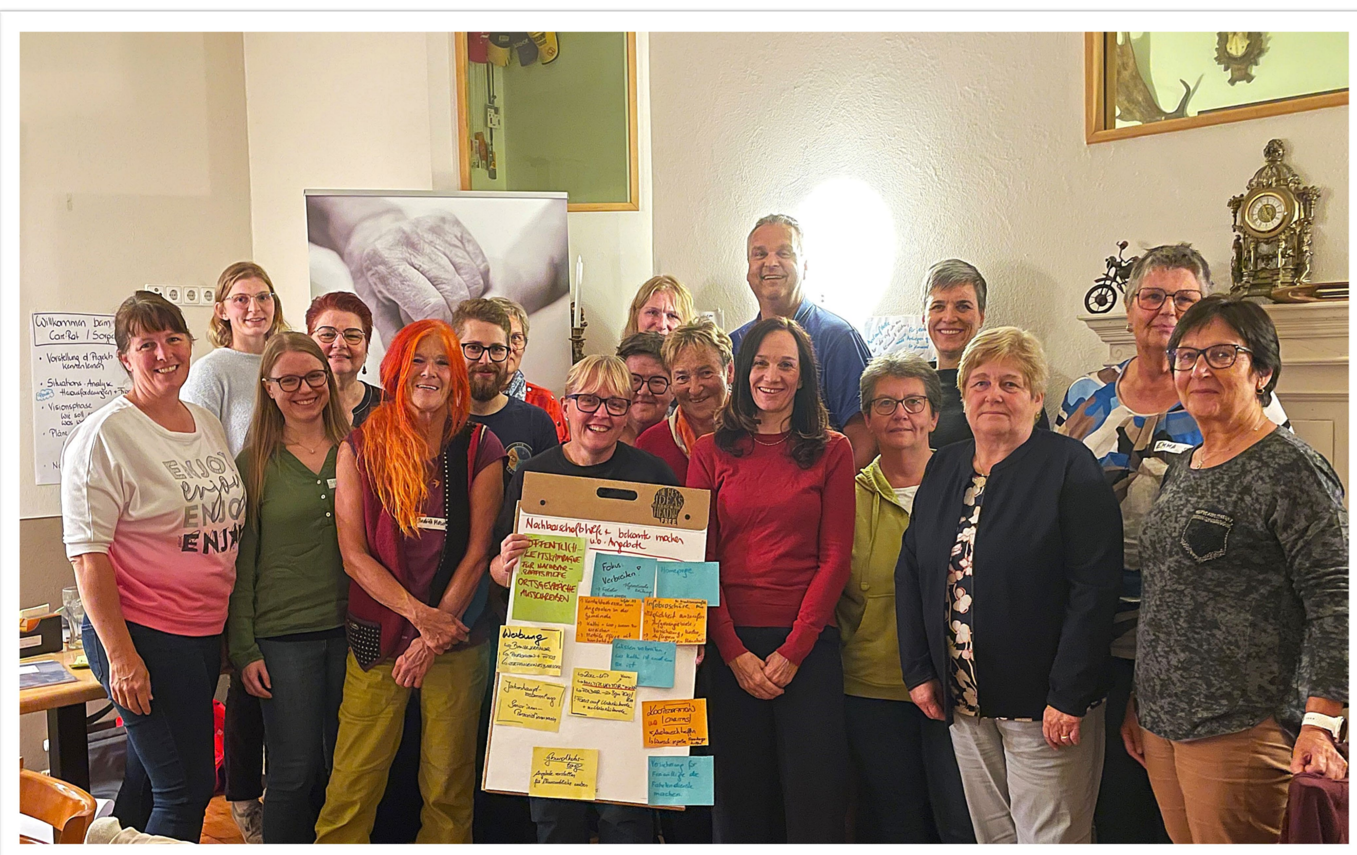
Care-Rat Groß-Siegharts, Sept. 2024

In einen Care-Rat gezielt mit einbezogen werden auch Akteur*innen, die eine oft unsichtbare, aber wichtige Rolle rund ums gute Miteinander spielen: engagierte Nachbar*innen, Bewohner*innen mit vielen Kontakten, Personen, die beruflich vieles „mitbekommen“ (Friseur*innen, Busfahrer*innen, Gastronom*innen, Lehrer*innen u.v.m.).