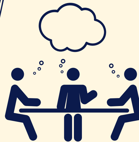
Mehrere Workshops mit Teilnehmer:innen der Photovoice